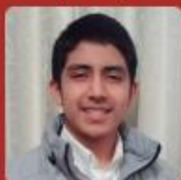
Fabián Enríquez Fiestas Arquitectura (USIL)