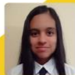
Carolina Mera Valdivia Arquitectura (UDEP)